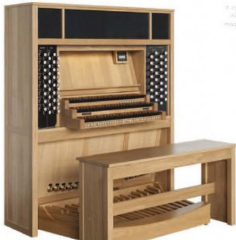
En Option: Combinaison de touches naturelle du bois sur bois

Une des caractéristiques importantes du Cantate 354 concerne la sonorité naturelle et la définition précise de chaque note. Un orgue pour le futur se présente aujourd'hui. Pas uniquement par sa nouvelle technologie mais aussi dans l'ensemble de la console, et de ses possibilités. L'orgue met en application les dernières normes au niveau de la consommation d'énergie pendant son utilisation. Une construction minutieuse et des contrôles éprouvés sont la base de la fiabilité de nos orgues. Venez écouter le Cantate 354! Une source d'inspiration infinie!