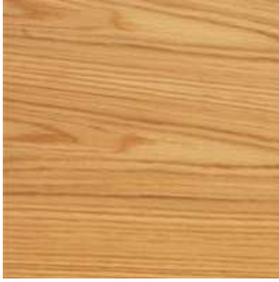
Bois clair (Deluxe),