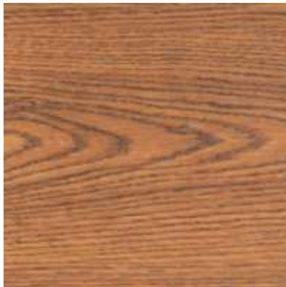
Bois foncé (Deluxe)

Disponible avec différentes couleurs-finitions